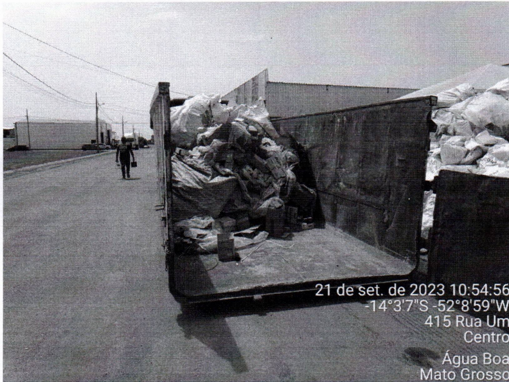
Resíduos sendo retirados e depositados na caçamba