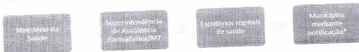
Figura 1: Fluxo da distribuição da medicação para o tratamento da hanseníase.

Sem mais para o momento, permanecemos à disposição para quaisquer esclarecimentos. Atenciosamente.