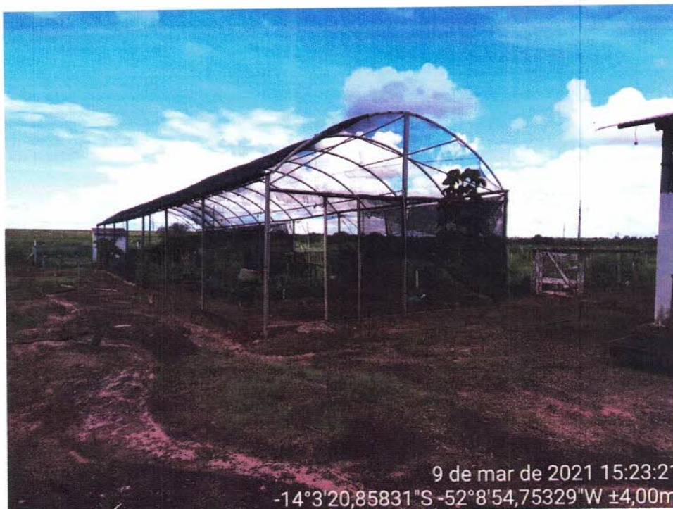
Figura 1 - Vista geral do viveiro.