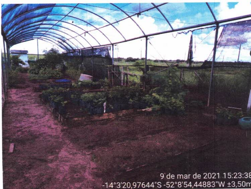
Figura 2 - Vista geral interna.