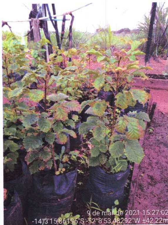
Figura 5 – Mudas de Tingui e Ipê produzidas em 2020.