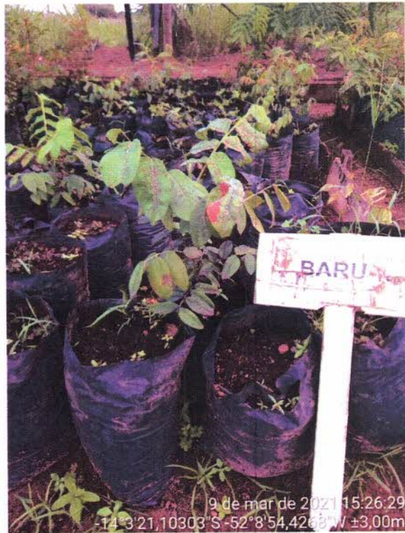
Figura 3 – Mudas de Anguquinho e Barú produzidas em 2020.