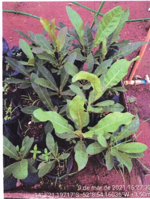
Figura 4 – Mudas de Gonçalo Alves e Ipê produzidas em 2020.